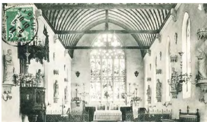
Intérieur de l'église en 1910

L'église collégiale avait été bâtie au début du XIV ème siècle, fondée par Guillaume d'Harcourt ; incendiée deux siècles et demi plus tard et rebâtie aussitôt, elle est incendiée de nouveau en 1875 et reconstruite. Elle fut bénie par Mgr Grolleau, évêque d'Évreux, le 31 août 1879, soit un peu plus de quatre ans après l'incendie. Elle fut de nouveau bénie le 4 ème jour des calendes de septembre 1910, c'est-à-dire le lundi 29 août 1910 et non le dimanche 28 août comme il a été écrit. En effet, dans le calcul complexe des jours, la veille des calendes correspond au 2 ème jour, l'avant-veille au 3 ème , etc. Mais pourquoi une nouvelle bénédiction en 1910 ?