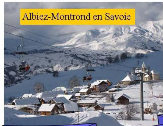
Albiez-Montrond en Savoie