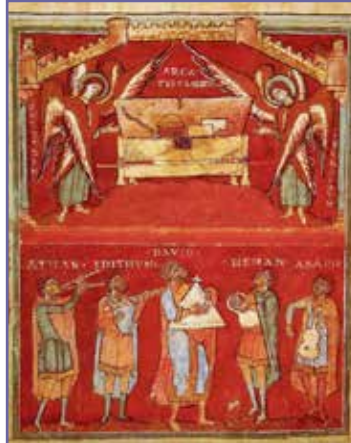
L'Arche d'Alliance et le roi David

Les Psaumes s'intègrent dans cette histoire du salut. Nous avons situé le début du chant d'hymnes de louanges ou de prières lorsque le roi David transfère l'Arche d'Alliance contenant les Tables de la Loi jusque dans Jérusalem. Après