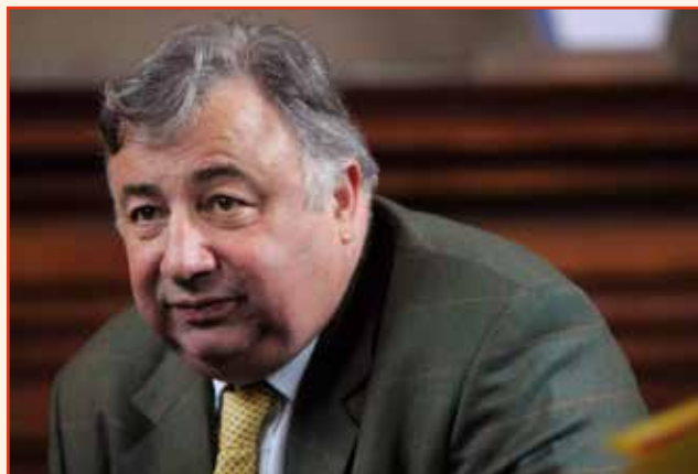
M. Gérard Larcher

Marcel Gauchet : Le vrai problème, c'est que l'islam n'est pas entré dans la démocratie, au sens non pas étroitement institutionnel, mais philosophique et métaphysique du terme, à savoir la liberté de l'homme de s'organiser hors de toute référence à une règle extérieure et supérieure. Le débat doit porter sur la laïcité en général : un règlement collectif visant une confession n'aurait pas de sens. Mais il concerne en particulier, bien sûr, la présence de l'islam. Car c'est cette dernière qui réveille la question de la laïcité, qui s'était assoupie. Il s'est avéré que certains courants islamistes, au-delà même du djihadisme militant, avaient pour but explicite de remettre en cause la laïcité à la française. Un islam politique s'est peu à peu cristallisé, par de multiples voies, sans qu'on prenne véritablement la mesure de son ampleur. Tout a changé avec les attentats