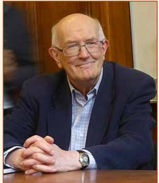
M. Marcel Gauchet

Marcel Gauchet : Aujourd'hui, la laïcité est ouvertement contestée, au nom d'une certaine conception de la religion. Nous