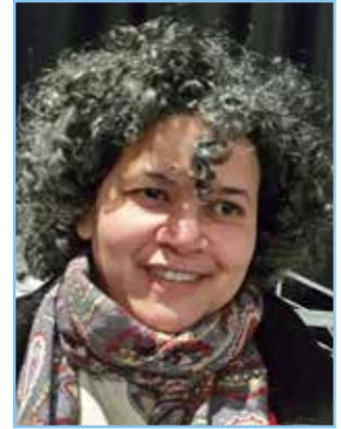
Béatrice Schenckery Membre du Conseil Episcopal