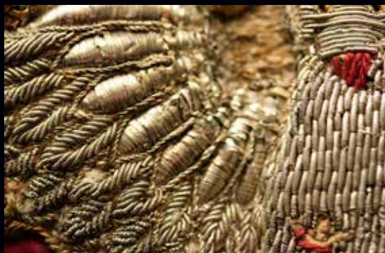
Détail du motif central d'un voile de calice et détail d'une aile. Pays d'Ouche. Broderie métallique sur fort rembourrage.