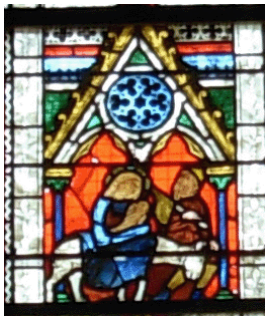
LA FUITE EN EGYPTE - chapelle n°XX

"Voici que l'Ange du Seigneur apparaît en songe à Joseph et lui dit: 'Lève-toi, prends avec toi l'enfant et sa mère, et fuis en Egypte; et restes-y jusqu'à ce que je te dise. Car Hérode va rechercher l'enfant pour le faire périr.' Il se leva, prit avec lui l'enfant et sa mère, de nuit, et se retira en Egypte; et il resta là jusqu'à la mort d'Hérode." (Mt 2, 13-14)