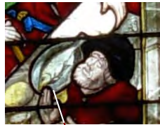
LES DISCIPLES D'EMMAÛS

"Voici que l'Ange du Seigneur apparaît en songe à Joseph et lui dit: 'Lève-toi, prends avec toi l'enfant et sa mère, et fuis en Egypte; et restes-y jusqu'à ce que je te dise. Car Hérode va rechercher l'enfant pour le faire périr.' Il se leva, prit avec lui l'enfant et sa mère, de nuit, et se retira en Egypte; et il resta là jusqu'à la mort d'Hérode." (Mt 2, 13-14)