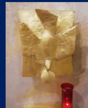
Tabernacle de l'église Notre-Dame des Champs à Paris