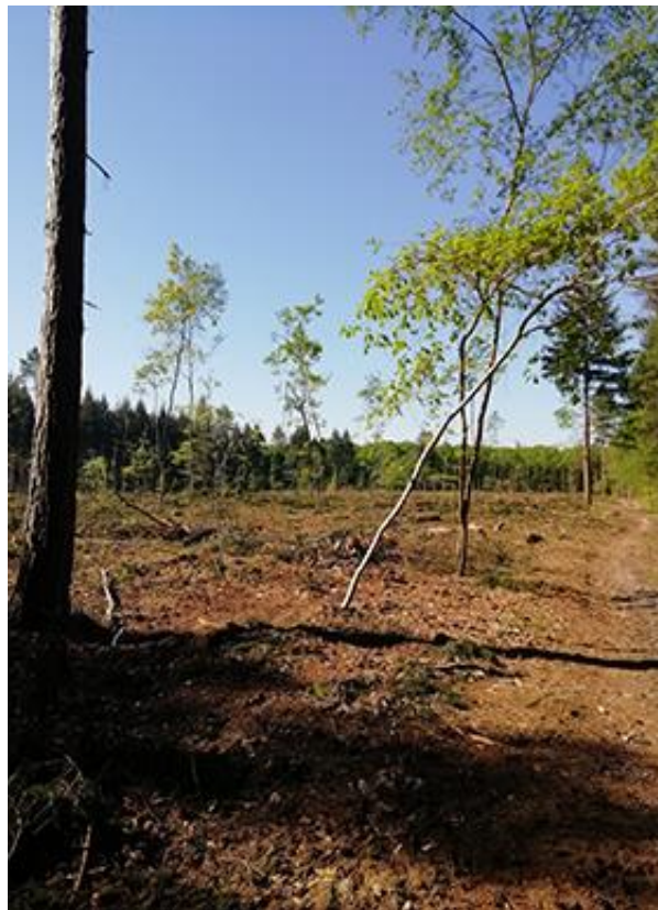
Forêt atteinte par les scolytes, conséquence du réchauffement climatique.

Faites-nous part de vos expériences en catéchèse, nous les mettrons dans EURE CATÉ pour que chacun puisse en profiter !