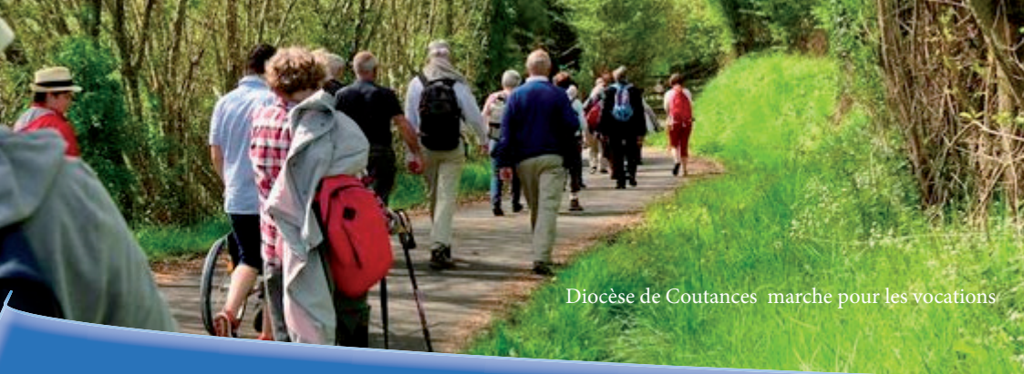
Diocèse de Coutances marche pour les vocations