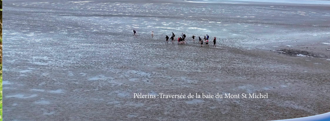
Pèlerins : Traversée de la baie du Mont St Michel