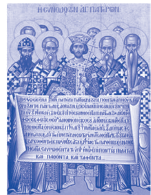
L'empereur Constantin entouré d'évêques exposant le credo en grec

Aujourd'hui encore, comprendre ce qui s'est joué à Nicée il y a 1 700 ans, c'est s'inscrire