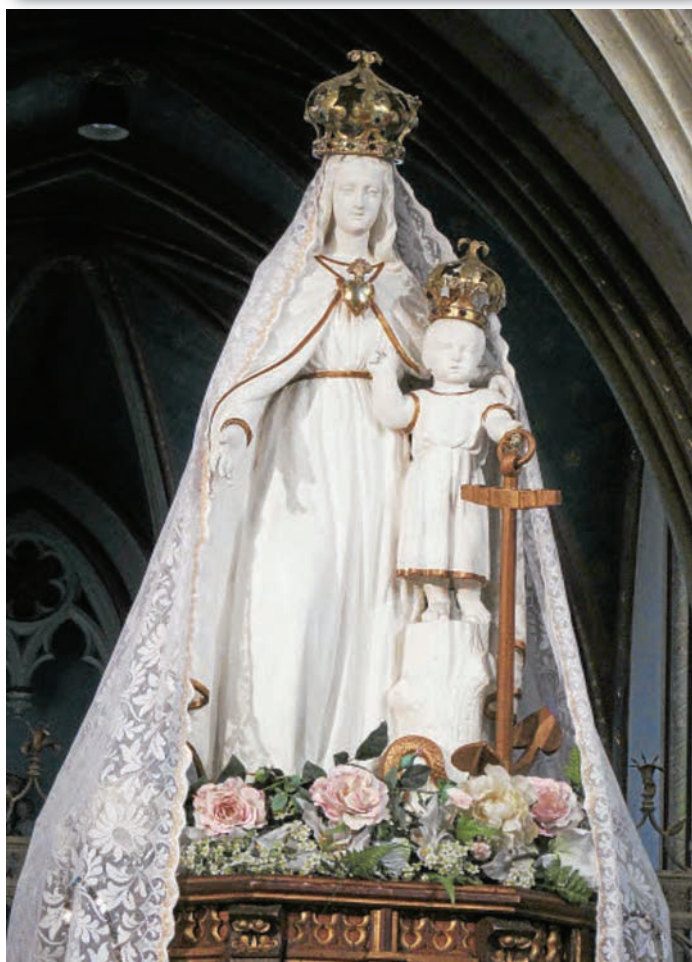
Statue de Notre Dame de l'Espérance Basilique de Saint Brieu

Maison paroissiale : 18 rue Sainte-Foy à Conches-en-Ouche. À commencer en nous.